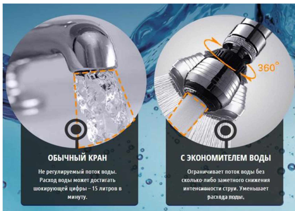
Рисунок 2 - Насадка-аэратор на кран

Поток воды, который протекает через сеточку аэратора, в месте заужения сосредотачивает давление. Расширительная мембрана с определенным количеством и диаметром отверстий, дает возможность воде равномерно распределить давление по диаметру всего аэратора. Поэтому, сверху расширительной мембраны создается область высокого давления, с обратной стороны мембраны, благодаря специальной форме, образует вакуум.